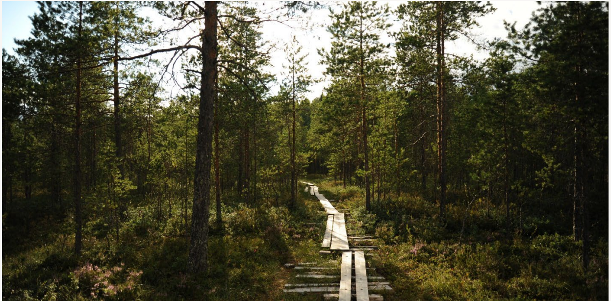
Kuva 7. Etelä-Pohjanmaalla on kattava ulkoilualueiden ja -reittien verkosto.

Tiedot ovat peräisin esimerkiksi Huomisen lakeus – Etelä-Pohjanmaan maakuntastrategiasta, Etelä-Pohjanmaan liiton tilastosivustolta sekä maakuntakaavan uudistamista varten laadituista teemakohtaisista selvityksistä.