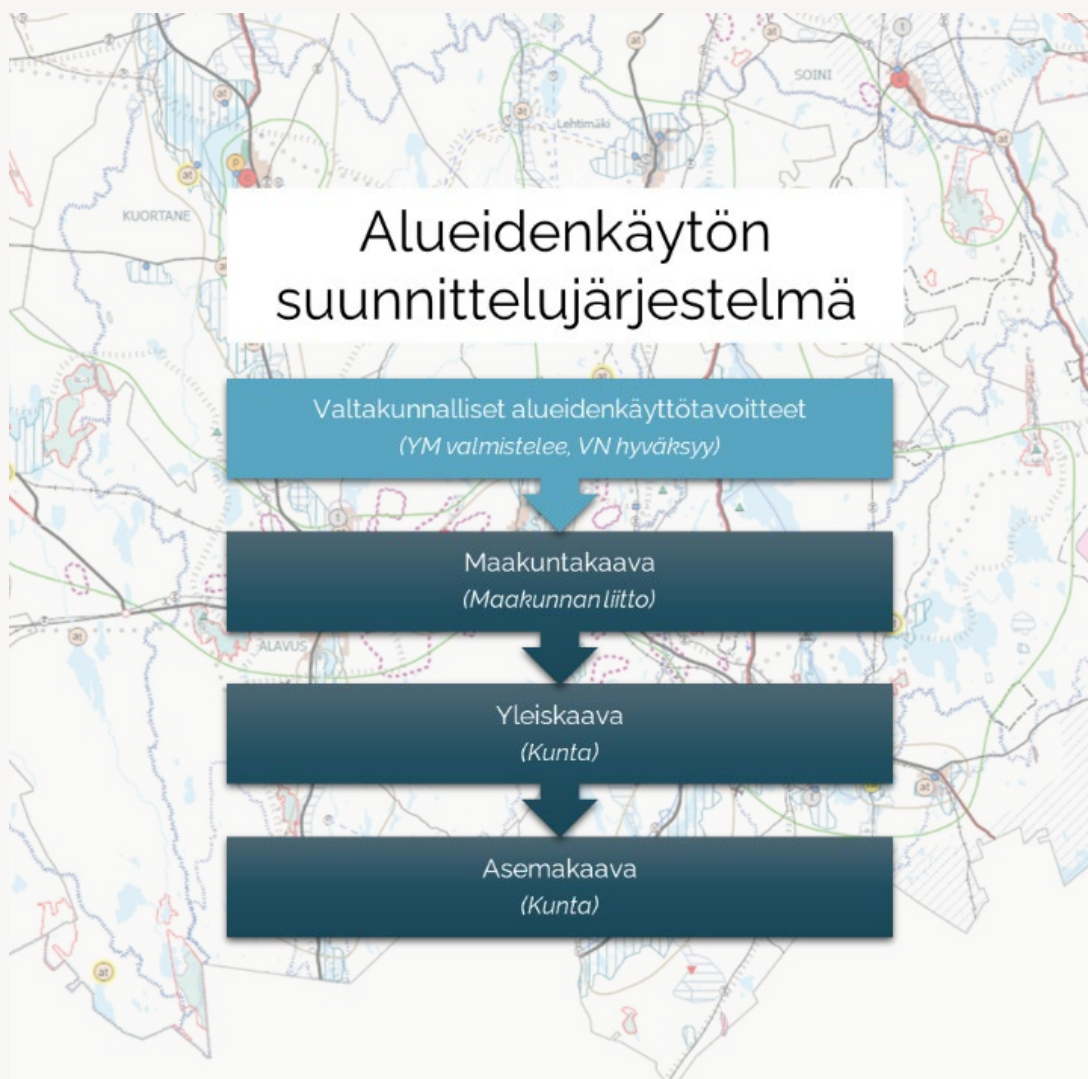
Kuva 2. Alueidenkäytön suunnittelujärjestelmä.

Alueidenkäytön suunnittelujärjestelmään kuuluvat maankäyttö- ja rakennuslain (MRL) mukaisesti valtakunnalliset alueidenkäyttötavoitteet (VAT), maakuntakaava, yleiskaava ja asemakaava (kuva 2).