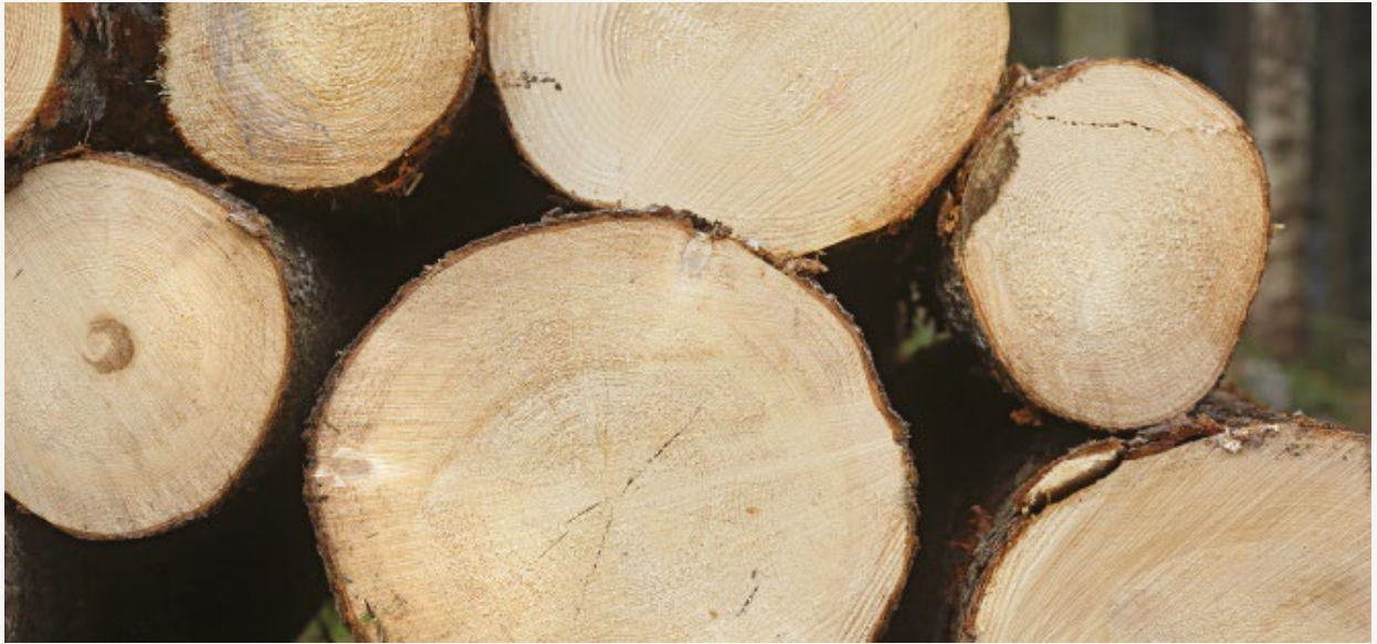
Kuva 6. Etelä-Pohjanmaalle on tyypillistä laaja metsäenergian käyttö.