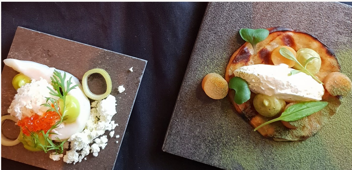
Kuva 5. Etelä-Pohjanmaalla ruoka-alan osuus alueen arvonlisästä on maakunnista korkein.