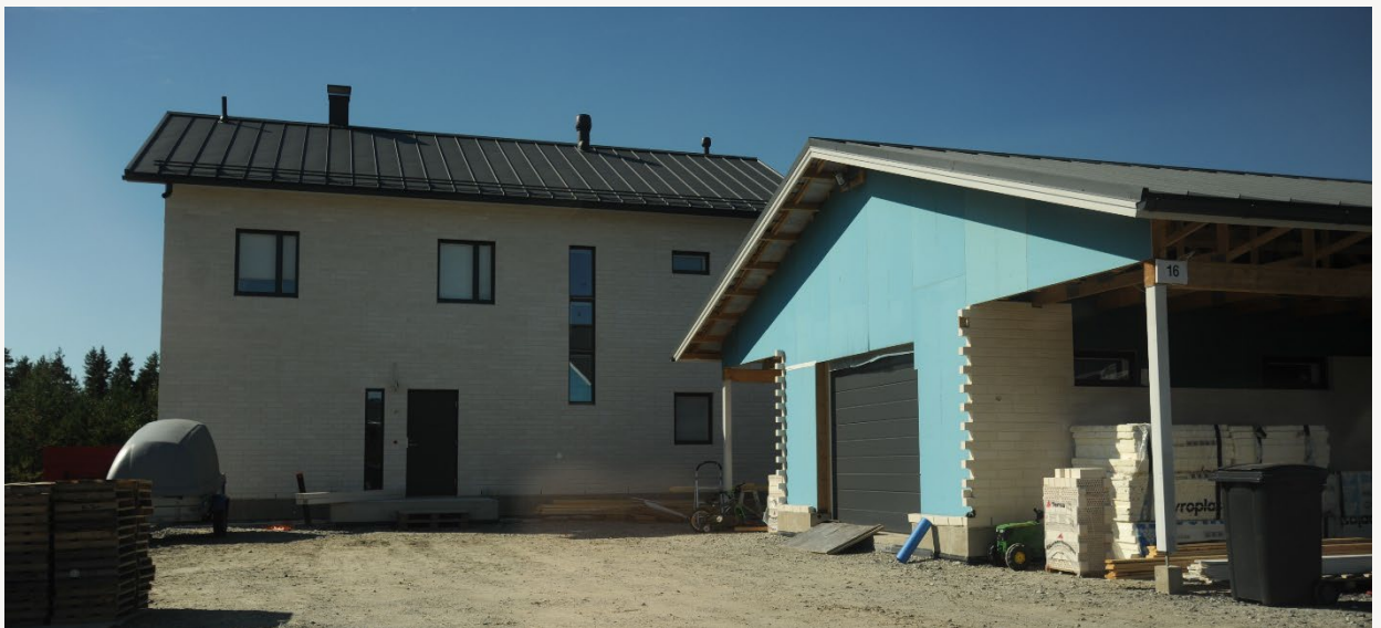
Kuva 4. Omakotitaloasuminen on Etelä-Pohjanmaalla maan keskiarvoa yleisempää.