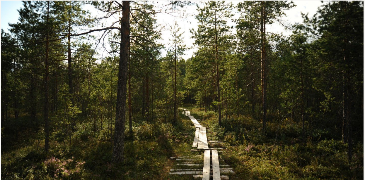
Kuva 7. Etelä-Pohjanmaalla on kattava ulkoilualueiden ja -reittien verkosto.

Tiedot ovat peräisin esimerkiksi Huomisen lakeus – Etelä-Pohjanmaan maakuntastrategiasta, Etelä-Pohjanmaan liiton tilastosivustolta sekä maakuntakaavan uudistamista varten laadituista teemakohtaisista selvityksistä.