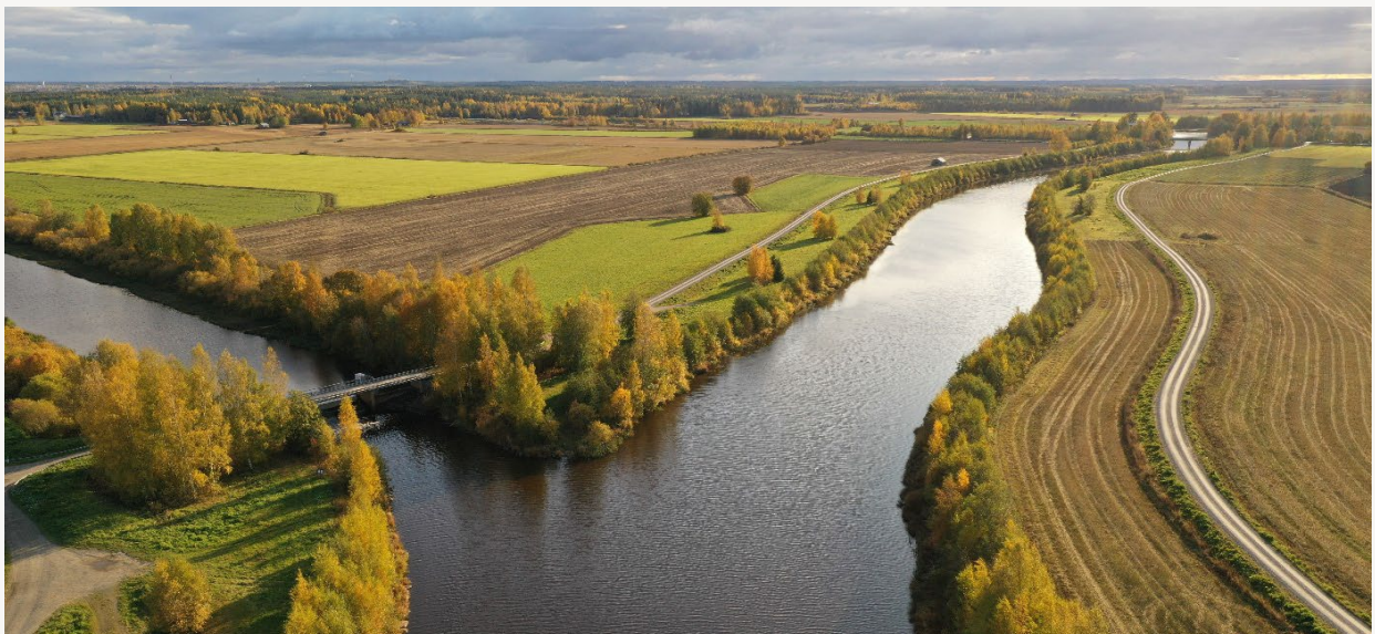
Kuva 3. Maakunnan maisemassa korostuvat peltolakeuksia halkovat joet.